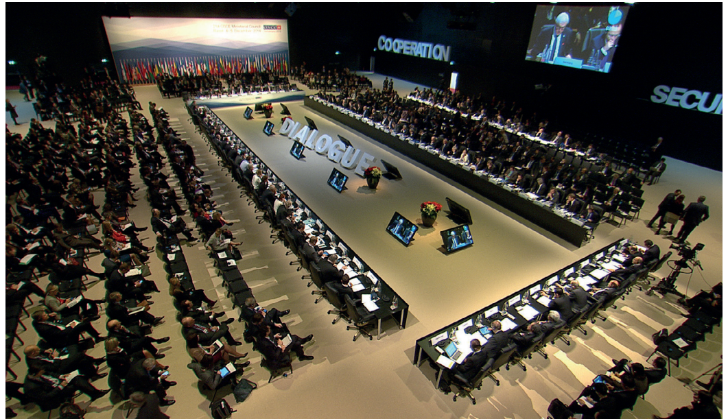
Die OSZE ist eine zwischenstaatliche Organisation, deren 57 Teilnehmerstaaten in allen Beschlussfassungsorganen gleichberechtigt zusammenarbeiten.

Inklusivität ist der rote Faden, der sich durch alle Aktivitäten der OSZE zieht. Alle Teilnehmerstaaten der OSZE sind gleichberechtigt, Beschlüsse werden mit Konsens gefasst.