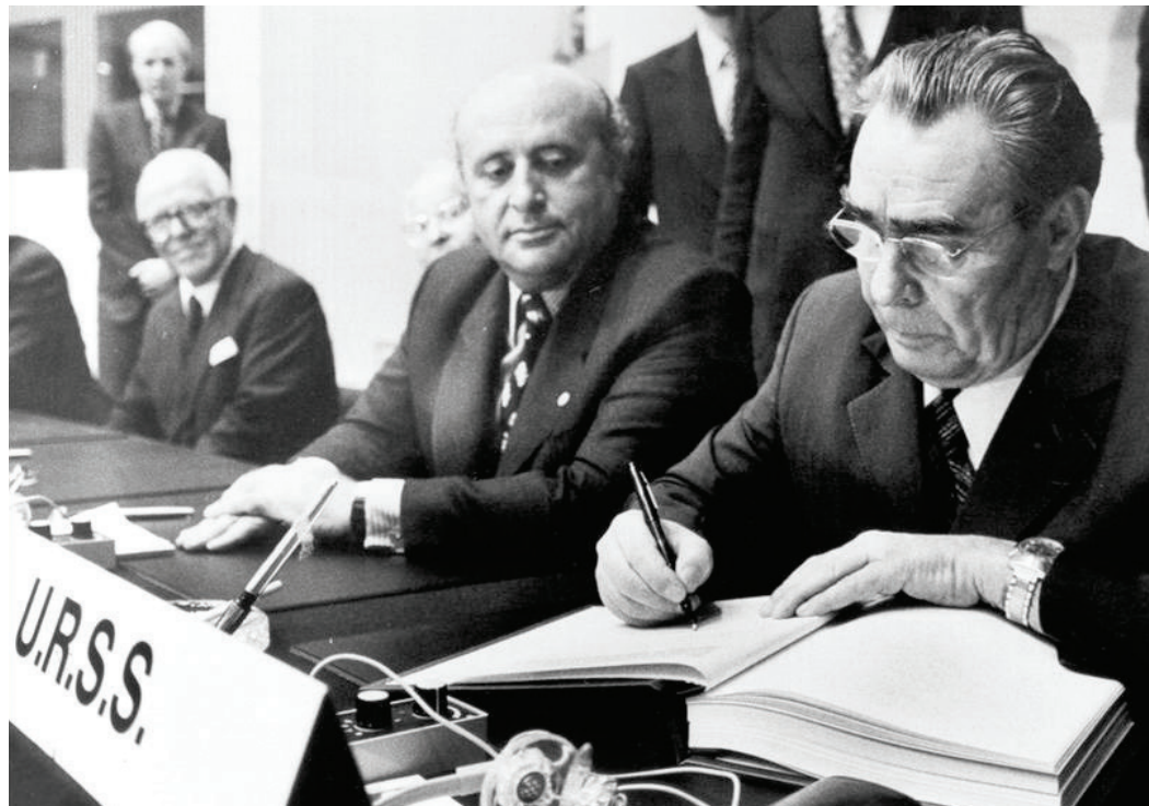
Die Schlussakte vom Helsinki, die am 1. August 1975 unterzeichnet wurde, stellte zehn Grundprinzipien (den sogenannten Dekalog) auf, die den Umgang der Staaten miteinander sowie mit ihren Bürgern regeln. Dieses Dokument ist nach wie vor die Richtschnur für die Arbeit der OSZE.

Die OSZE geht auf die frühen 1970er-Jahre zurück – auf die Schlussakte von Helsinki (1975) und die Gründung der Konferenz über Sicherheit und Zusammenarbeit in Europa (KSZE), die während des Kalten Krieges als wichtiges multilaterales Dialog- und Verhandlungsforum zwischen Ost und West fungierte.